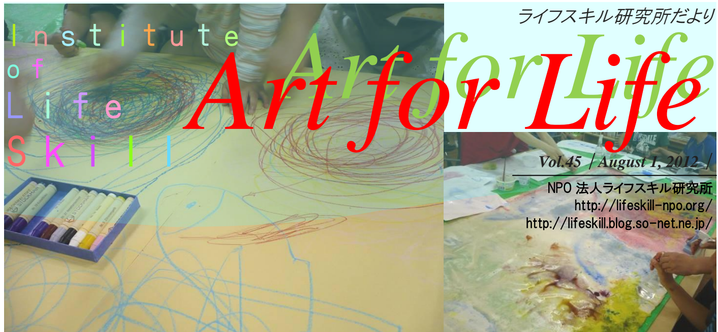
家ではかけないような大きな紙でダイナミックにぐるぐる描き(街かどアートすぽっと)